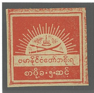
独立ビルマの国家紋章 (1943年)

第2次世界大戦中のアジアにおいて、1942年3月、日本軍はイギリスの植民地ビルマへ進攻し、首都ラングーンを占領した。以後、イギリスが再び支配を取り戻すまでの3年余りの間、ビルマは日本の支配下にあった。この間に、日本はビルマの独立を認めたが、実態は日本の傀儡であった。