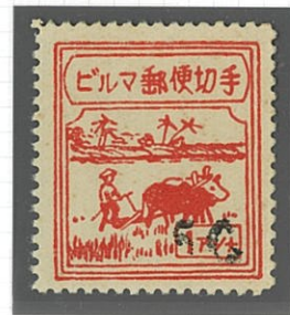
加刷位置バラエティ

1アンナ 1枚貼普通便 Danbi-Henzada → Moulmein 1942. 12. 5