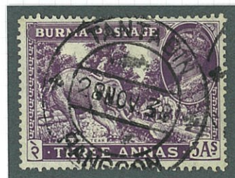
イギリス植民地時代

本作品は、このような日本占領下にのみ現れたビルマ独立義勇軍切手及び正刷切手に着目し、本格収集への入門的試みとして、そのアウトラインをワンフレームに展開した小さなコレクションである。